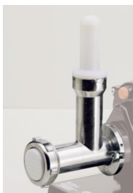
TORCHIO PER PASTA